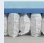
DUO DREAM TF 22

Modell-, Farb- und Maßabweichungen bleiben vorbehalten. Für Druckfehler übernehmen wir keine Haftung.